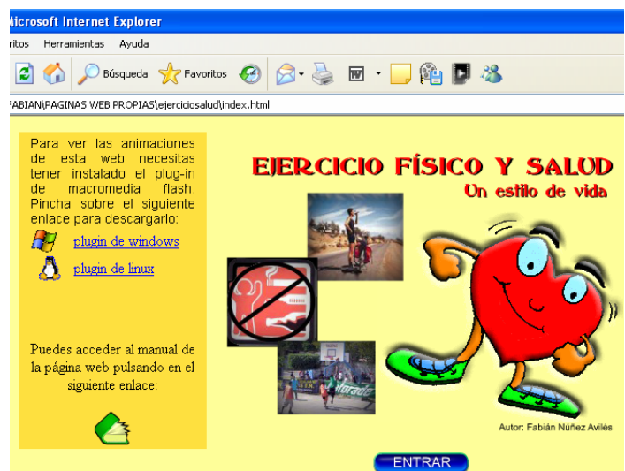
Ejercicio Físico y Salud: un estilo de vida. Premio de la Junta de Andalucía a recursos educativos de software libre año 2006.